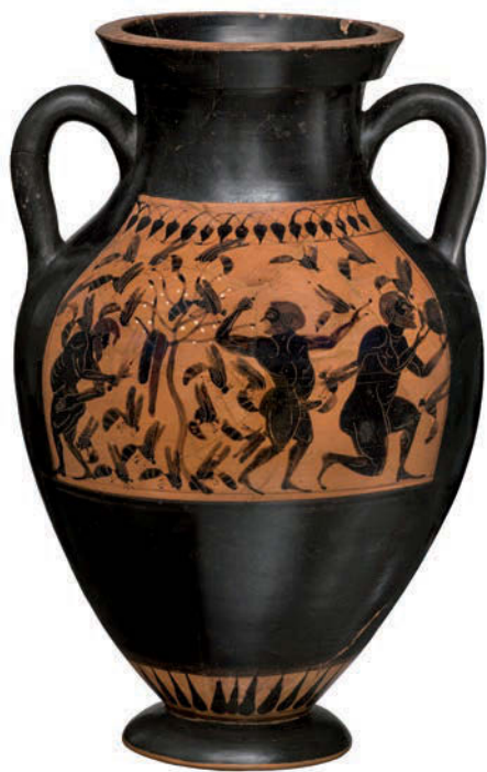
Anfora attica a profilo continuo a figure nere del Pittore dell'Altalena, 540-530 a.C. ca. Antikenmuseum, Basilea