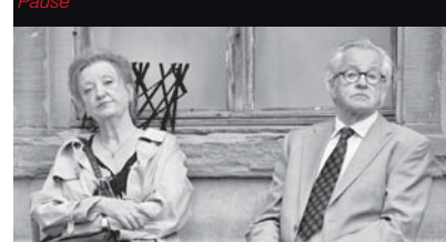
Liebe und Zufall