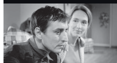
Unter der Haut