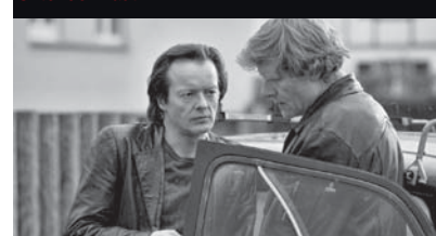
Der Goalie bin ig