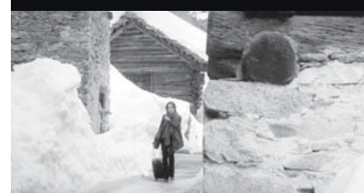
Come un morto ad Acapulco