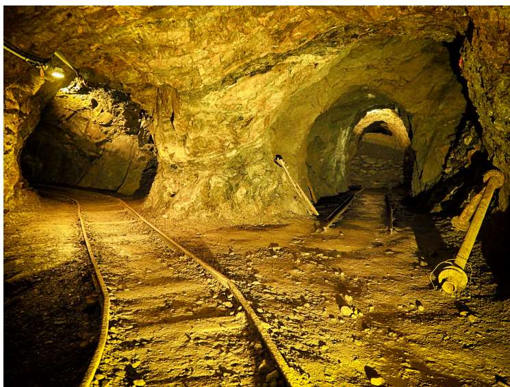
Immagine: all'interno della Miniera.